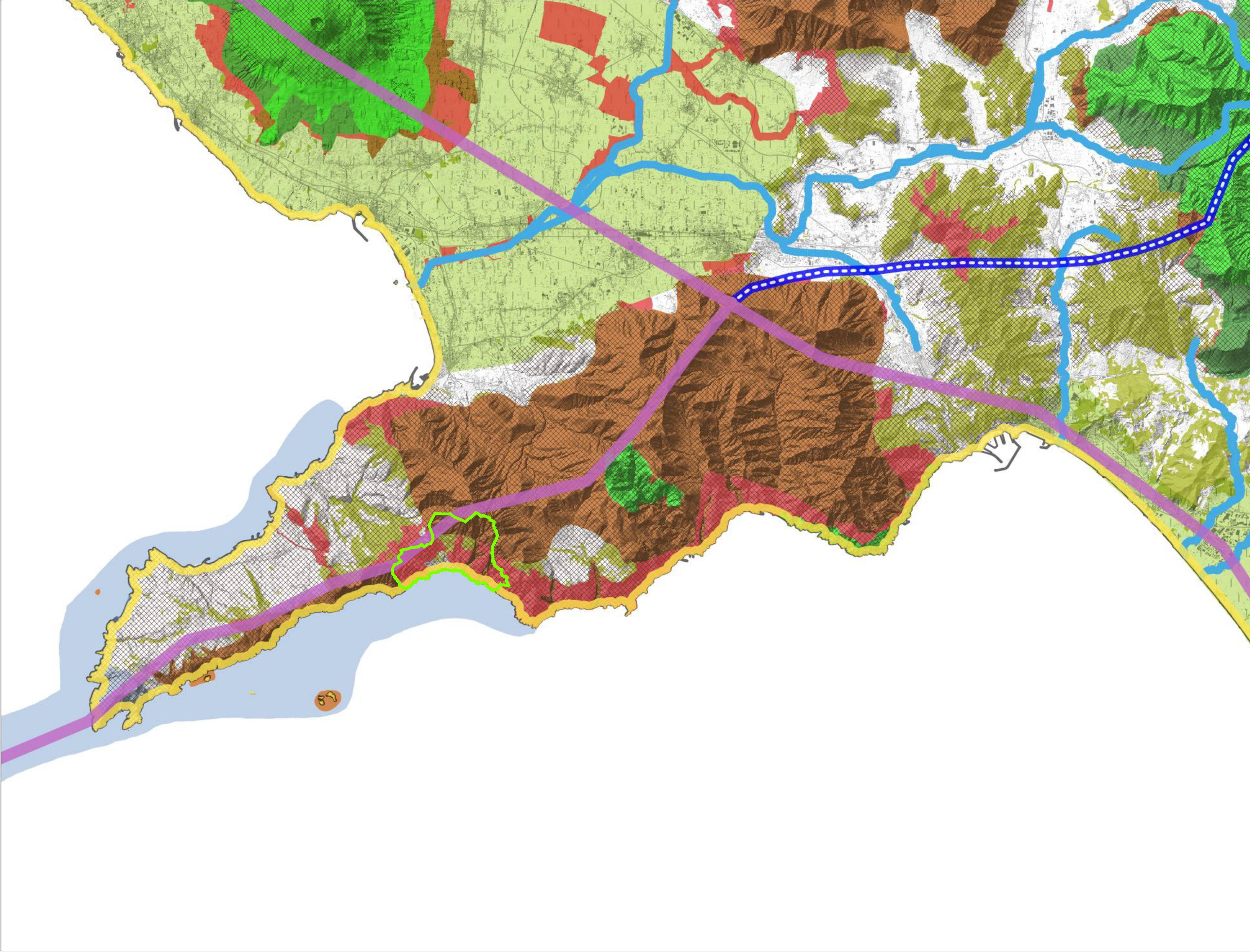
LETTURA STRUTTURALE DEL PAESAGGIO : Rete ecologica e schema